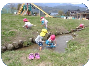
天気の良い日は、園庭のせせらぎで水遊びを楽しみます。