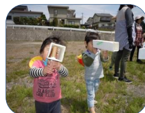
未満児さんは牛乳パックの手作りカメラで写真撮影。