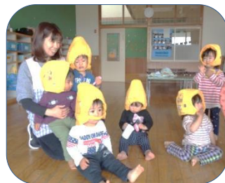
未満児さんも年少さんも初めての防災ずきんをかぶってみました。