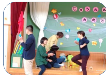
避難の方法について先生たちの寸劇を見て学びました。