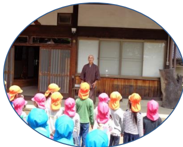
法音寺さんのお花まつりに呼んでいただきお釈迦様に甘茶をかけたりのちそうになったりしてきました。