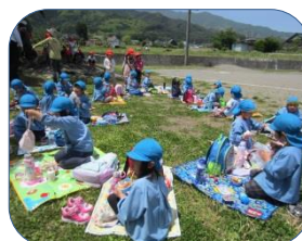
お母さんの手作りお弁当美味しいね。年中、年少の様子。