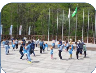
年長は恒例の親子遠足で、国立信州高遠青少年自然の家へ行ってきました。