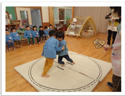
「がんばれー」応援にも熱が入ります

1月には、毎年恒例の「みなみっこ初場所」を開催しました。各クラスでは何度も「取り組み」が行われ、お相撲を楽しんだ子どもたちです。お部屋の壁には何枚ものトーナメント表が貼られていました。一人ひとり考えた自分の四股名もなかなか個性的で「〇〇やま」や「〇〇ふじ」「〇〇りゅう」に加え、見事に大関昇進を果たした「みたけうみ」も登場しました。稽古を重ねた子どもたち。みんな強くなりました！