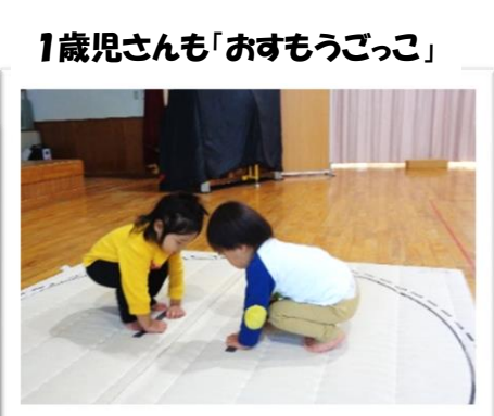
1歳児さんも「おすもうごっこ」