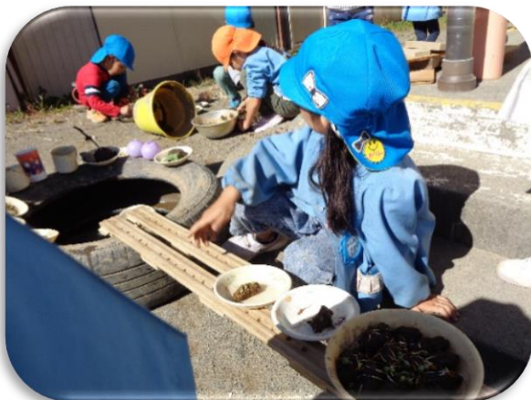
「おすし、流れま〜す！」 お寿司がテーブルへ。もちろん手動です…