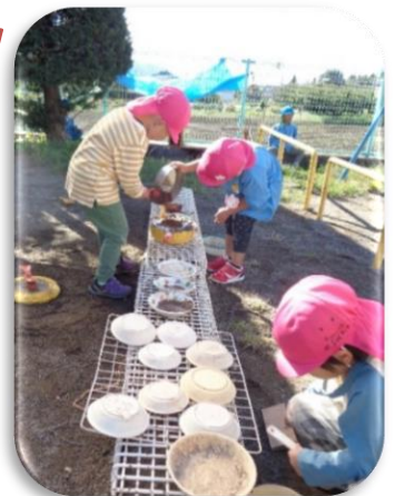
こちらは、カレー屋さん。フライパンでカレーを作っています。