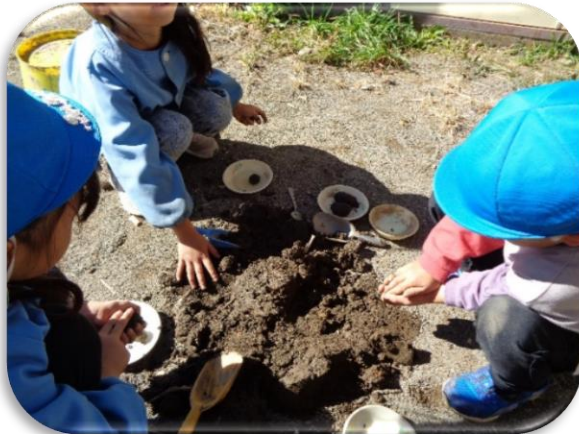
回転寿司やさんごっこ。「おすしは、こうやって握るんだよ」

9月には運動会、10月には遠足やカレーパーティーなど行事もたくさんありました。戸外での遊びも盛んで、子どもたちは登園すると園庭に飛び出し、砂や赤土はもちろん、タイヤや塩ビ管、端材などを工夫して使い、思い思いのあそびを楽しんでいます。