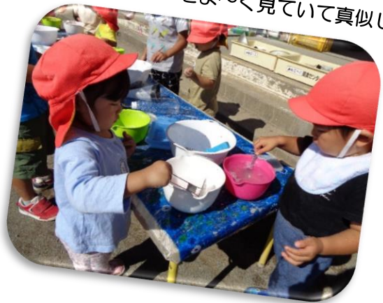
未満児さんも石鹸の泡立てに挑戦！お兄さんお姉さんの遊びをよ〜く見ていて真似します