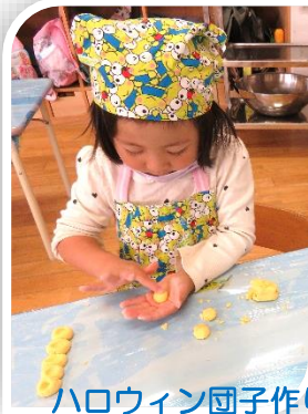
ハロウィン団子作り