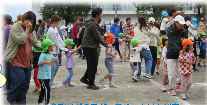
全親子がつながったじゃんけん列車

年長さんは、保育園最後の運動会。 年中さんは、2回目の運動会。 年少さんは、初めての運動会。 毎年子どもの姿に感動します。