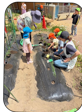
幼児さんがみんなで相談した野菜の苗を畑に植えました。大きく育ててね！ (裏面へ)