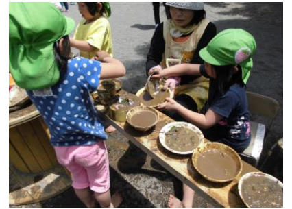
カウンターではごちそう作りが盛んです