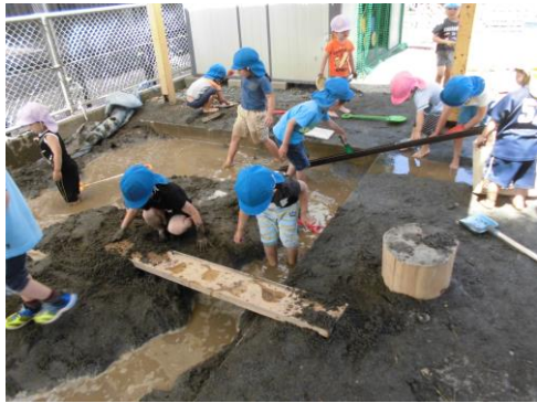
砂場では水を流してダイナミックにダム作り