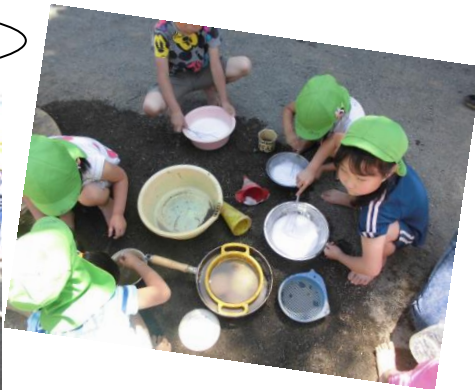
あわあわ遊びでクリーム作りに挑戦