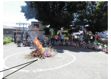
小鳩園と合同で七夕流し