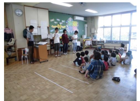
伊那北高校器楽サークルの皆さんと