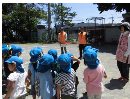
脳いきいき講座に出張！