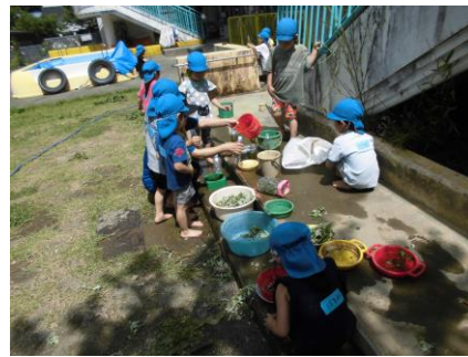
草花・木の実もおままごとのごちそうです