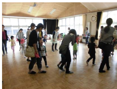
ハロウィンできたっせに立ち寄り・・・