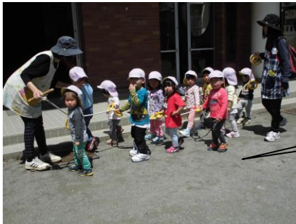
あちこちお散歩にも出かけます！