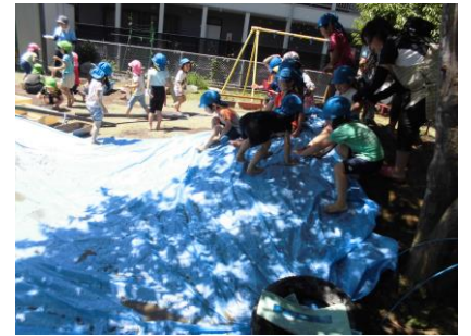
赤土山にブルーシートを広げてすべり台