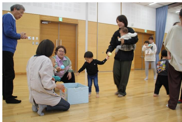
わいわいくらぶ 11月18日(火) ミニ運動会で 心も体もぽっかぽか😊