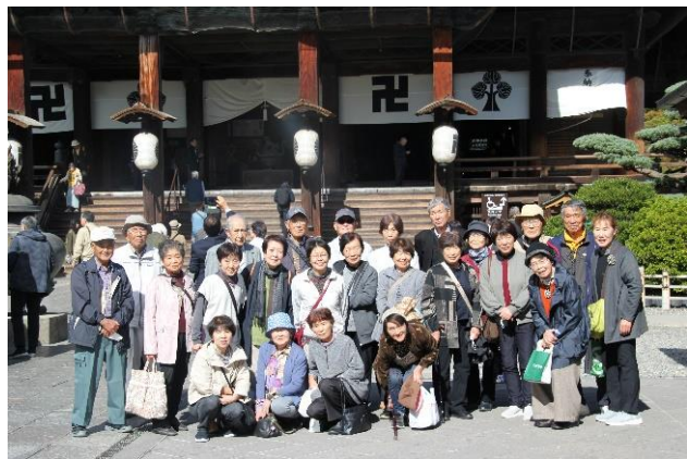
四ツ葉の集い 10月28日(火) 「善光寺」参拝で 健康や交通安全をお祈り卍