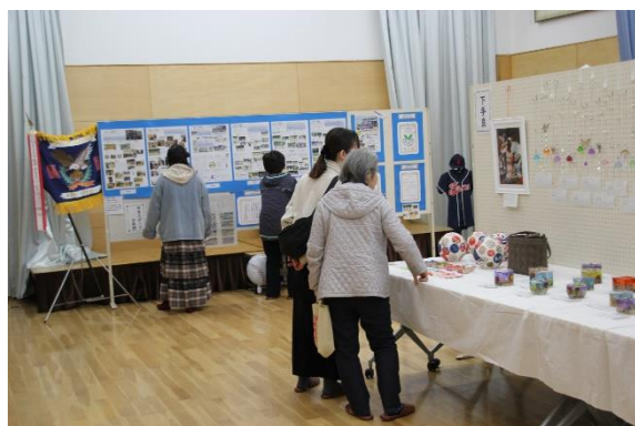
手良スポ少・地区の展示🌟