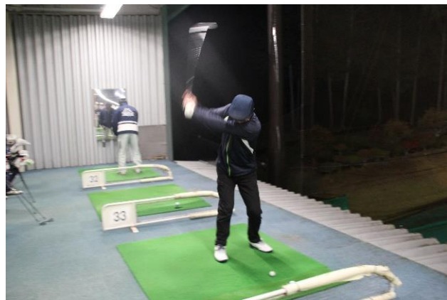
ゴルフ教室 10月31日(金) ネット目指して パワフルスイング🔥