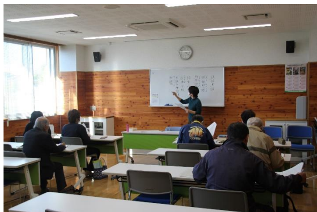
手良の歴史講座 11月17日(月) 今年度最後の古文書解読。 興味のある方は来年度ご参加ください。