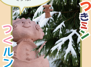
伊那市創造館マスコットキャラクター