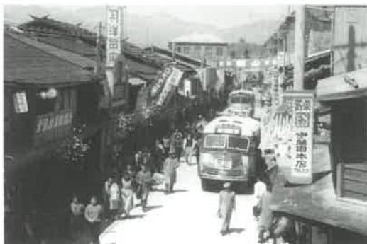
昭和30年代の本町通り