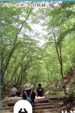
パワースポット分杭峠